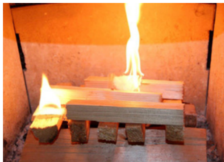
Fyr fra toppen. Bygg med tørre vedkubber nederst, opptenningsved og opptenningsbriketter øverst.

Regelmessig rengjøring reduserer risikoen for brann. Aske og sot er varm i flere dager. Når du tømmer ildstedet for aske må du bruke en ubrennbar beholder med lokk.